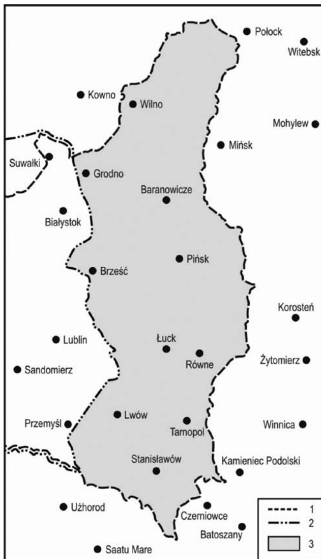
Ryc. 6. Wschodnia granica Polski (1921-1939 oraz po 1945 r.)

1 – wschodnia granica Polski wg traktatu rosyjskiego z 18 marca 1921 r.,