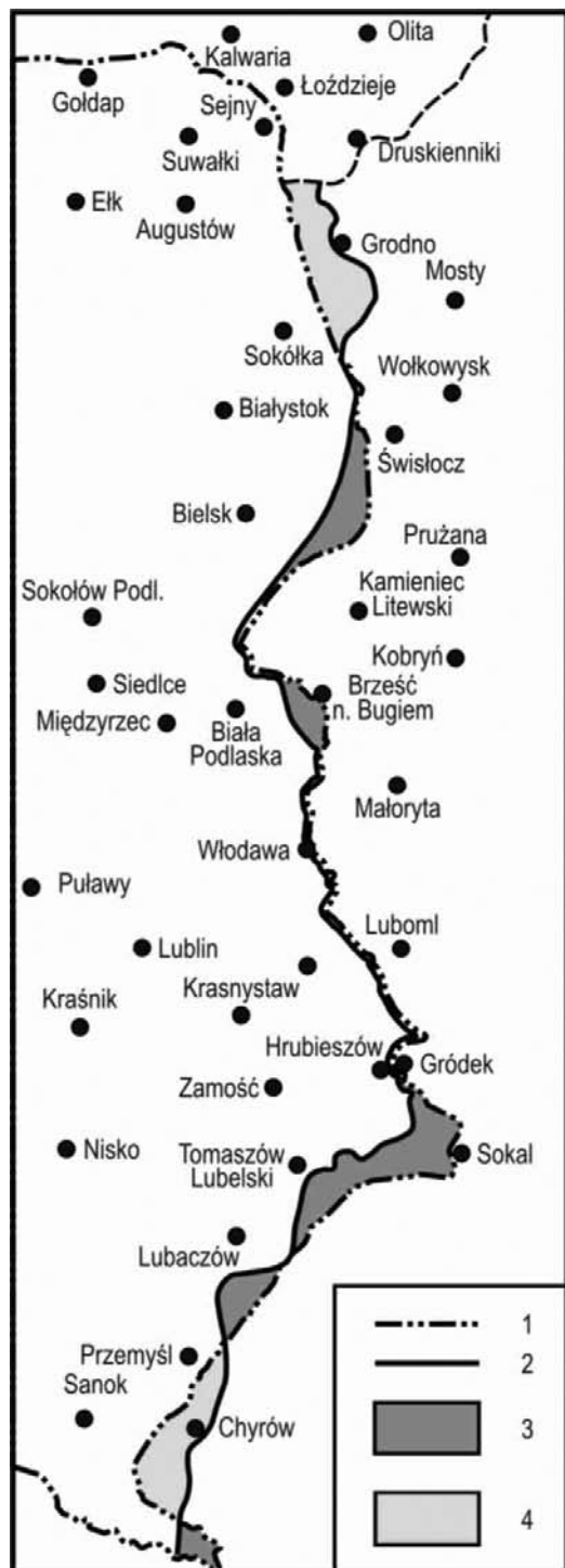
Ryc. 5. Powojenna wschodnia granica Polski oraz linia Curzona

1 – granica wschodnia Polski po II wojnie światowej, 2 – linia Curzona, 3 – obszary włączone do Polski położone na wschód od linii Curzona, 4 – obszary niewłączone do Polski położone na zachód od linii Curzona