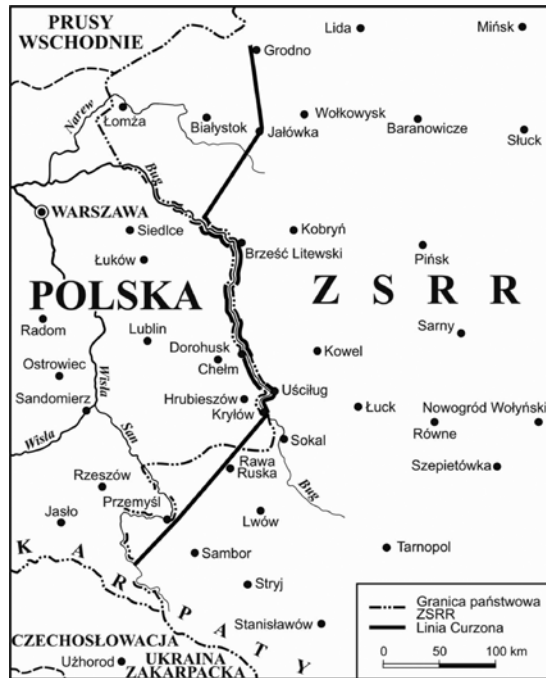
Ryc. 4. Linia Curzona według poglądu sowieckiego