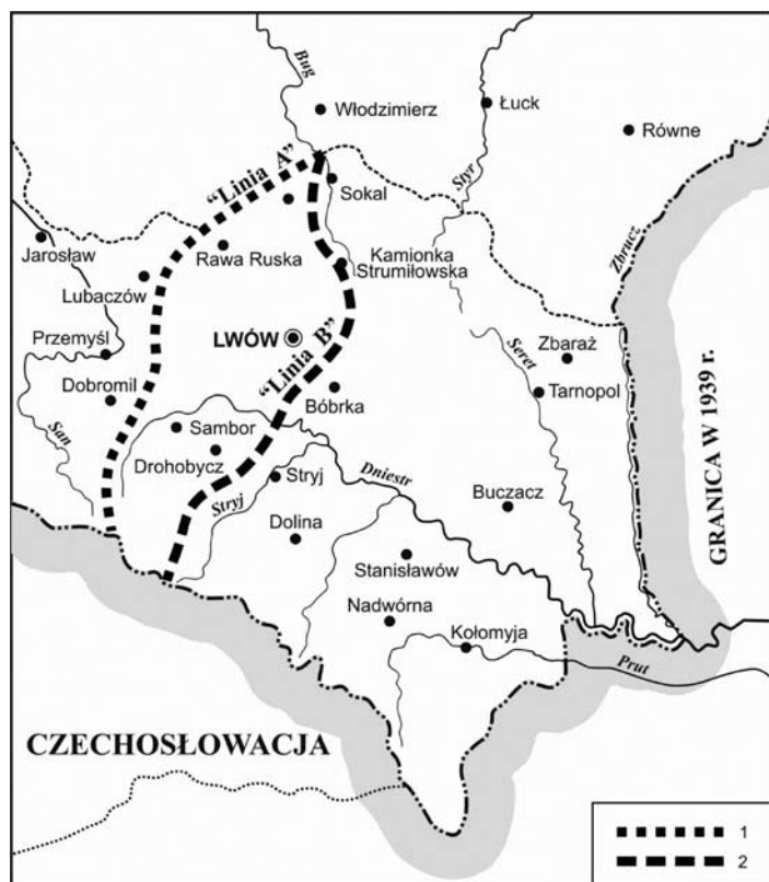
Ryc. 2. Rozgraniczenie Galicji według linii Curzona (wariant „A” i „B”)

1 – „Linia Curzona A”, 2 – „Linia Curzona B” Opracowanie własne na podstawie: L. Kirkien, Russia, Poland and Curzon Line , Edynburgh 1944, s. 64.