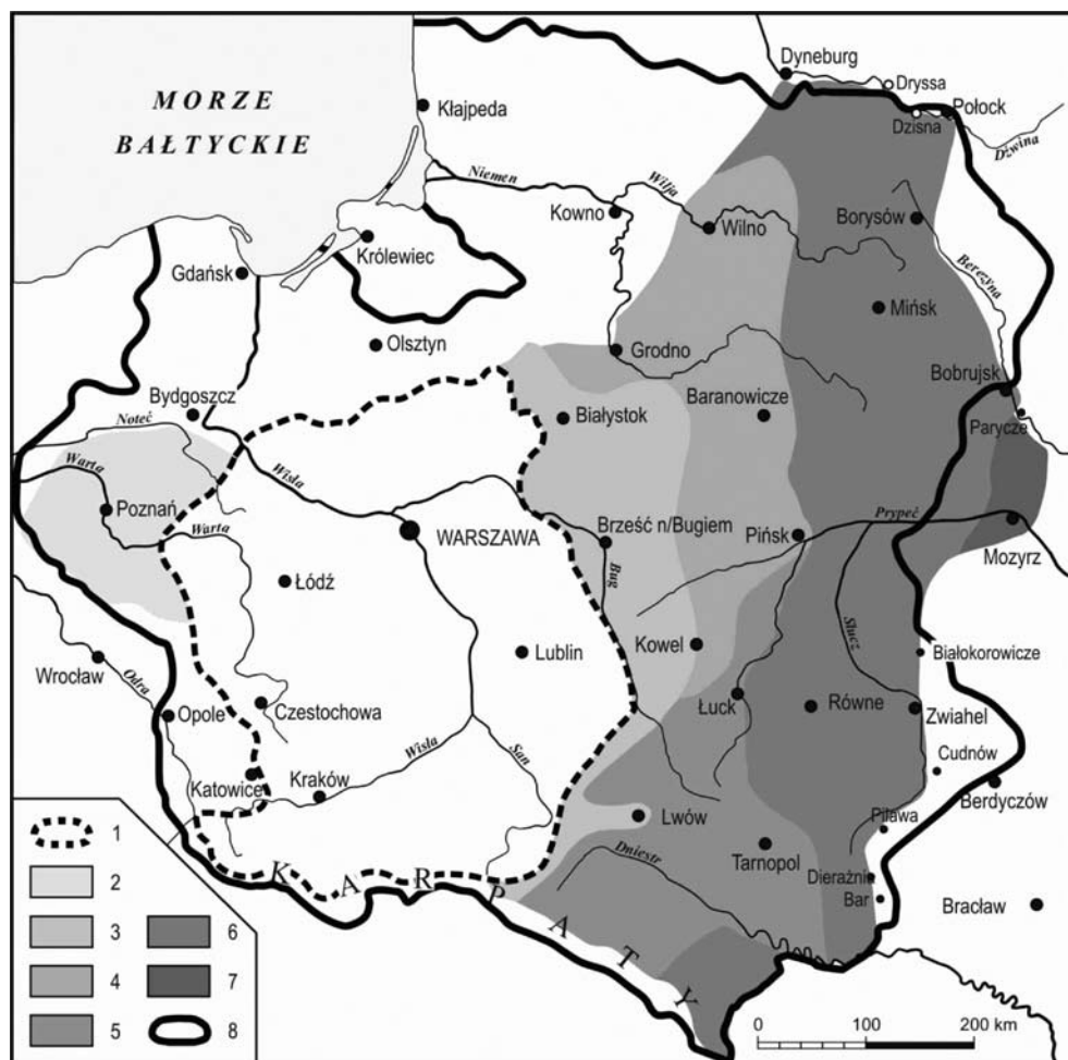
Ryc. 3. Wyniki działań zbrojnych Wojska Polskiego. Obszary opanowane w okresie: koniec 1918 r. – początek 1920 r.

1 – listopad 1918, 2 – styczeń 1919, 3 – luty 1919, 4 – maj 1919, 5 – lipiec 1919, 6 – sierpień-grudzień 1919, 7 – marzec – 1920, 8 – linia Dmowskiego.